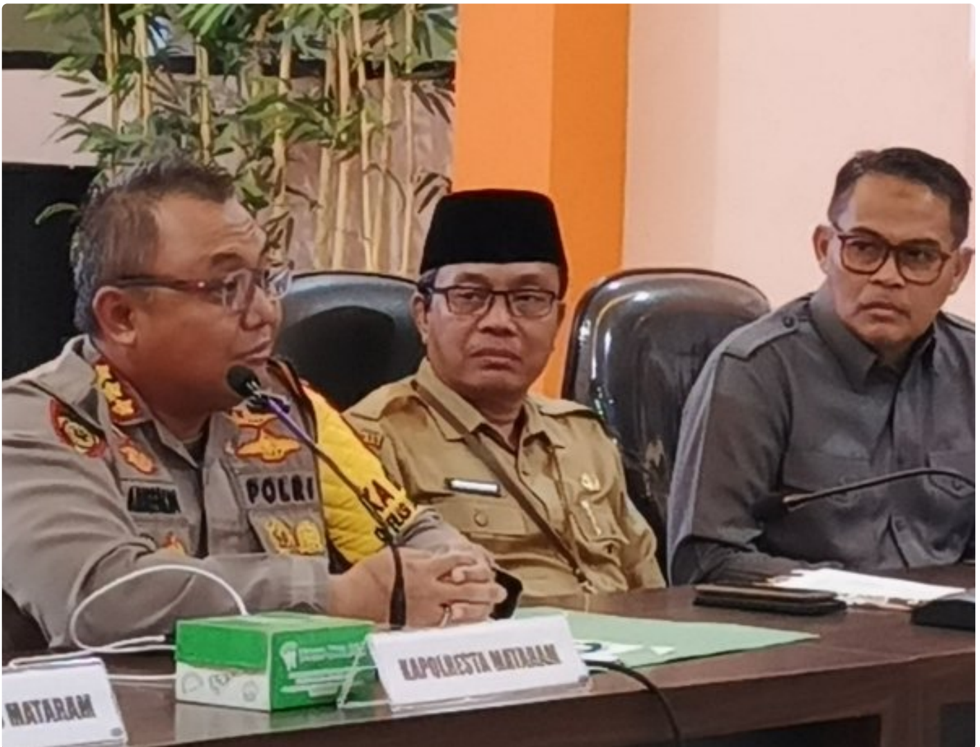
Kapolresta Mataram (Kiri) saat memimpin Konferensi pers akhir tahun, Selagi (31/12/2024)

MATARAM, NTB – Polresta Mataram mengakhiri tahun 2024 dengan menggelar