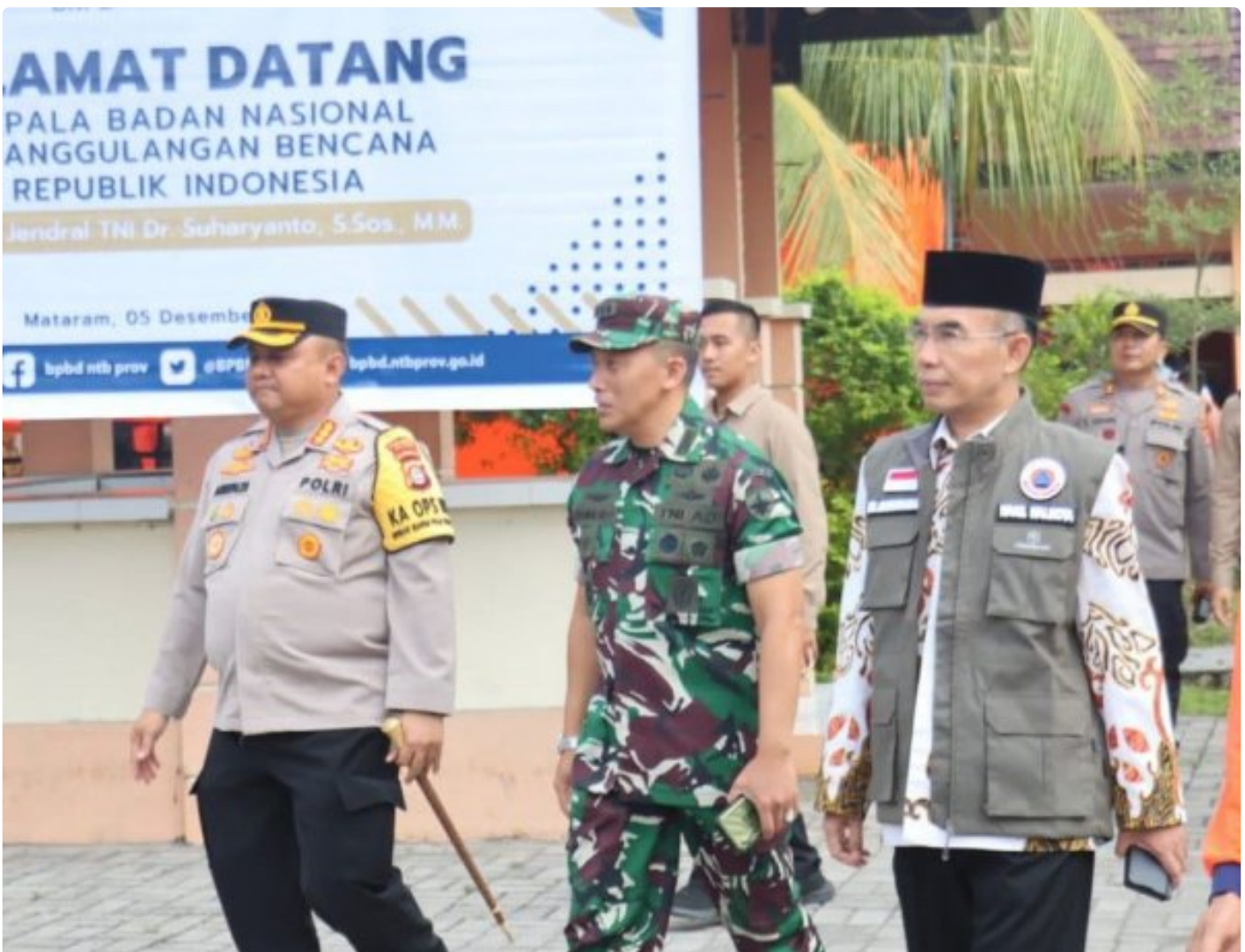
Kapolresta Mataram (Kiri) saat menghadiri acara Peletakan batu Pertama pembangunan gedung Pusdalops BPBD NTB, Kamis (05/12/2024)